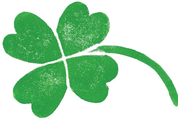
ein vierblättriges Kleeblatt