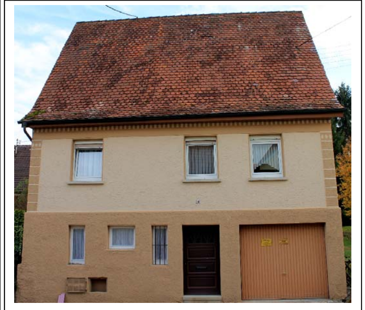
Abb. 2: Haus 11, Obere Dorfstraße