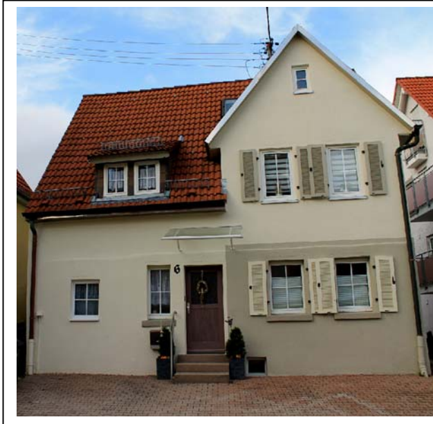
Abb. 1: Haus 6, Obere Dorfstraße

2. Ordnen Sie die Häuser 15, 13, 11, 9, 6, 3 und 2 in ihre jeweilige Kategorie zu