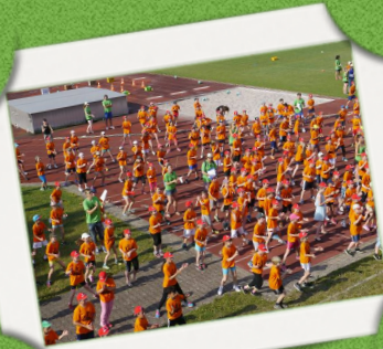
MINIBAROCKTURNIER MIT ÜBER 400 KINDERN!