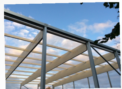
SOMMERANGEBOT CLIMB IN THE AIR