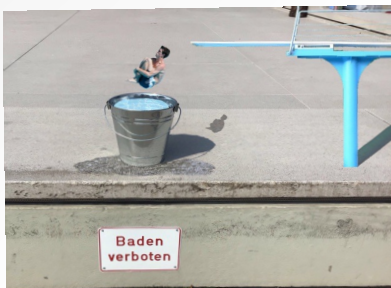
NEUE MODULHANDBÜCHER VIRTUELLES SPRINGEN