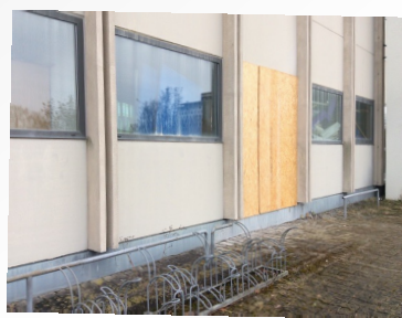
KUNSTAKTION „HOLZ STATT BETON“